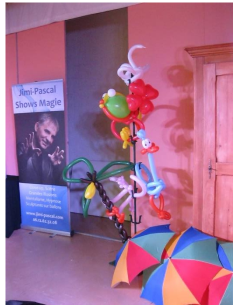
... un bananier avec un singe, une fleur, un poisson, la panthère rose, Bip-Bip, un cygne, des colombes dans un cœur, ils seront accrochés à l'école.